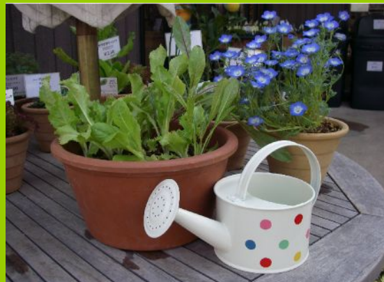
《作品例》 *実際に作成するものとは異なる場合があります。 使用する植物は当日までお楽しみに♪

植付けた後の育て方から たくさん収穫する裏技まで公開します ので、ベランダやお庭の空いたスペース でお楽しみください♪